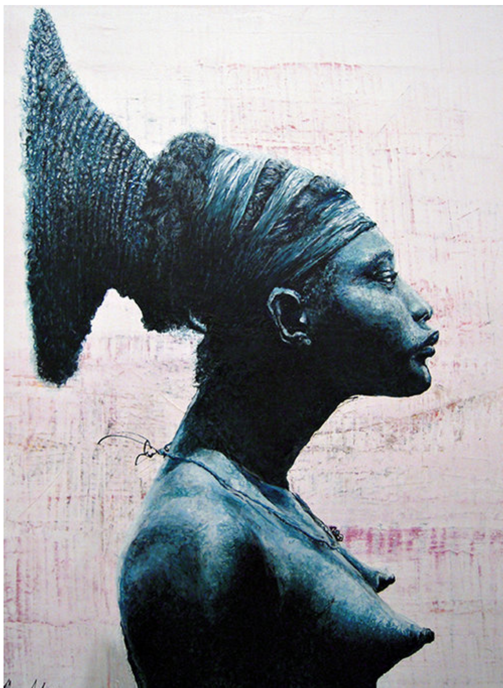
היצירה Patience.

"יש לי הרבה רעיונות, בא לי לעשות משהו ענקי, שיעמוד כמו אי באמצע הים, מין פסל שיזוהה עם רצועת החוף שלנו. יש לי סקיצה של מבנה כזה, זה נראה כמו לווייתן ענקי, מבנה שיהיה מוזיאון שמגיעים אליו רק בסירה, שההתהלכות בסביבתו תראה כמו הליכה על המים".